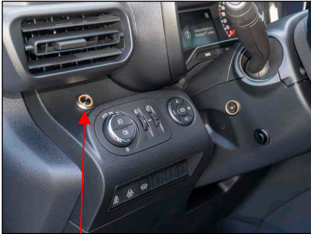
Dachzeichen-Schalter DS Variante 1