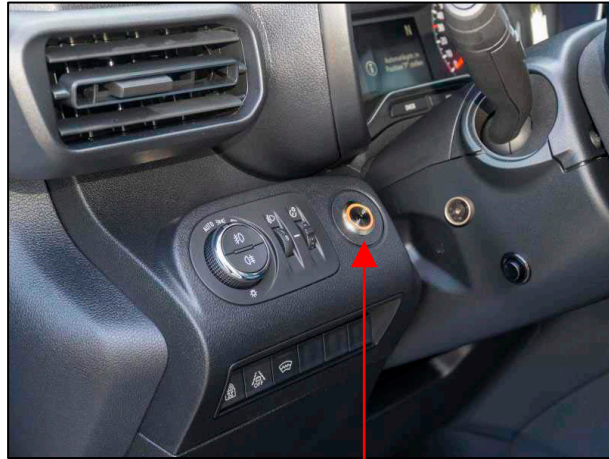
Dachzeichen-Schalter DS Variante 2